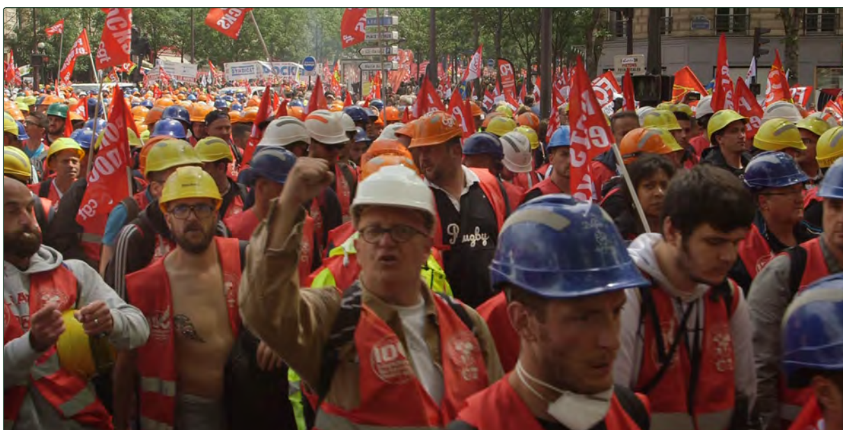
Manifestation contre la loi travail, 15 Juin 2016

Je voulais que cette histoire sonne juste, qu'elle soit directement liée à la mémoire des Havrais et que ce ne soit pas un récit historique ou de spécialiste. Il fallait que ça résonne dans le vécu des gens.