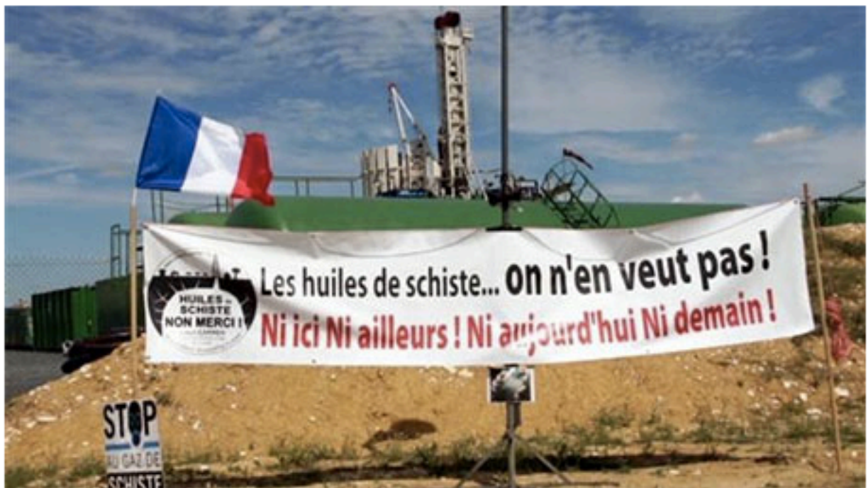
No Gazaran.

Le 30/03/2014 à 12h41- Mis à jour le 28/03/2014 à 16h46 Mathilde Blottière